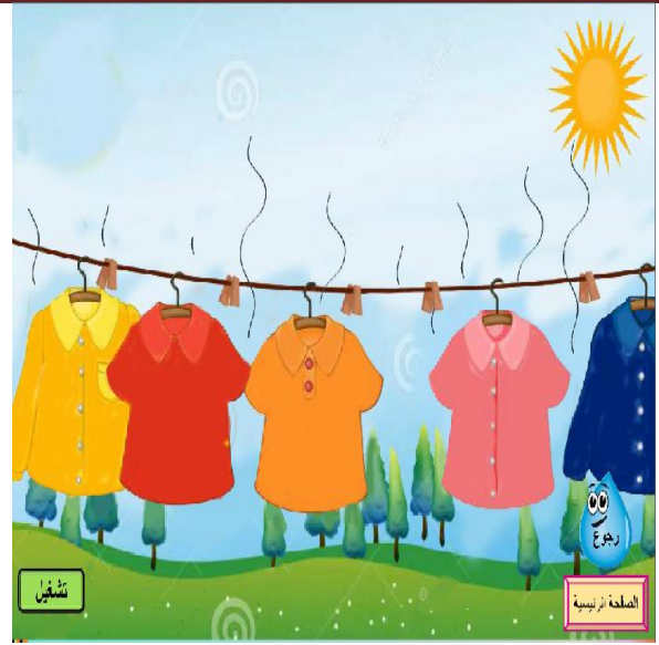
شكل(3) شاشة عملية البخر وهي إحدى أجزاء درس الماء وتغيرات الحالة.