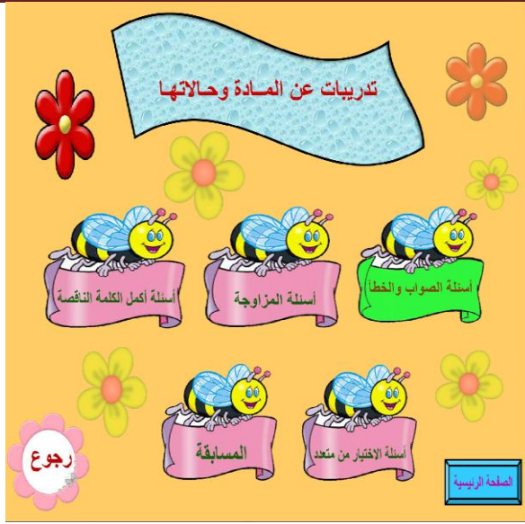
شكل(4) شاشة تدريبات تخصص درس المادة وحالاتها.