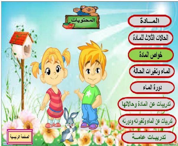
الشكل (2) الشاشة التي تظهر عند اختيار درس الدورات من شاشة التمهيد وأقسام ودروس الوحدة.

يبدأ البرنامج التعليمي عند تشغيله بشاشة العنوان، تليها شاشة التمهيد التي تحتوي على مشهد تمثيلي بالرسوم المتحركة يعطي تمهيداً عن الدروس التي ستتم دراستها، مع العلم بأن كل الشرح في البرنامج التعليمي يتم عن طريق الرسوم المتحركة أو أفلام الفيديو التعليمية معزلاً بالنصوص عند الحاجة، كما أنه عند اختيار أي تدريب تعرض شاشة تحتوي على إرشادات عن كيفية سير التدريب، واستخدم التعزيز ببعض الحمل التحفيزية والوجوه التعبيرية. وبهذا يكون قد تم إعداد وإنتاج برنامج تعليمي محوسب قادر على شرح وحدتين من مادة العلوم للصف الرابع. تبين الأشكال التالية بعض شاشات البرنامج التعليمي المحوسب.