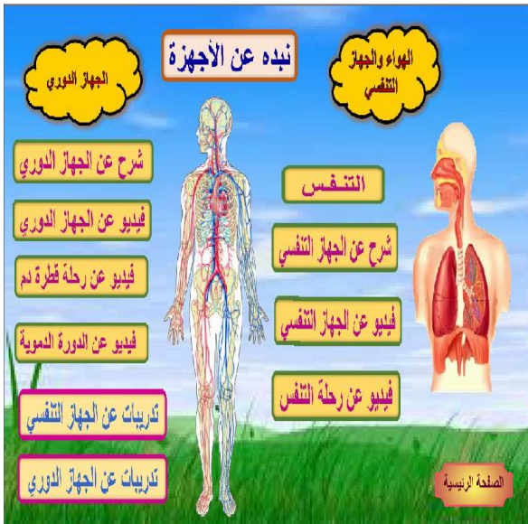
الشكل(6) الشاشة الرئيسية لدروس وحدة الأجهزة