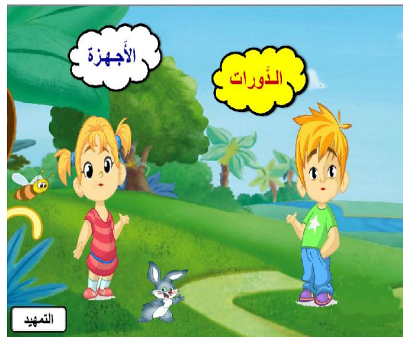
شكل (1) شاشة تمهيد البرنامج التعليمي